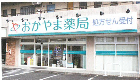
おかやま薬局 本部 (岡山市北区)

一方、安心・安全の調剤体制をつくるために、同グループ薬局では調剤過誤防止への取り組みも図ってきた。月に1回、危機予知トレーニングを店舗で行い、調剤ミス件数を減少させている。しかし、この試みは「計数ミス」の減少にはつなげなかった。ミスの内容を調べると、その6割は「名前・規格ミス」であることが分かり、こうしたミスをゼロにすることを目標に、調剤過誤監査システムの導入を決定したという。