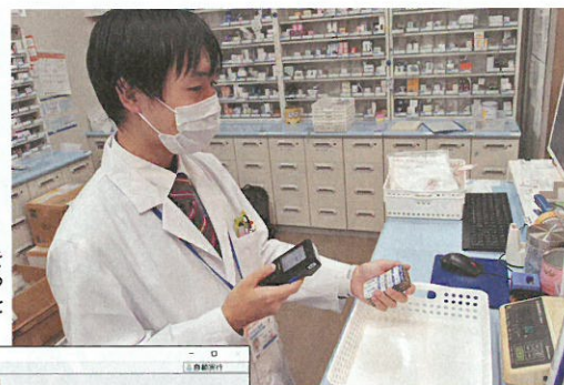
ミスゼロ子は、その使用率をいつでも確認することができる

「天満店は薬品数の多い処方箋の取り扱いが多いため、毎回画像照合をしていると時間がかかり、待ち時間の増加になるため、GS1コードを読み取るだけで簡単に監査できる『ミスゼロ子』に注目、会社に導入をお願いしました。当時、オーソライズド・ジェネリックが急速に増えていたのですが、薬剤の色や形が先発品と似ているため、間違いを防ぎたいという思いもありました」(当時の