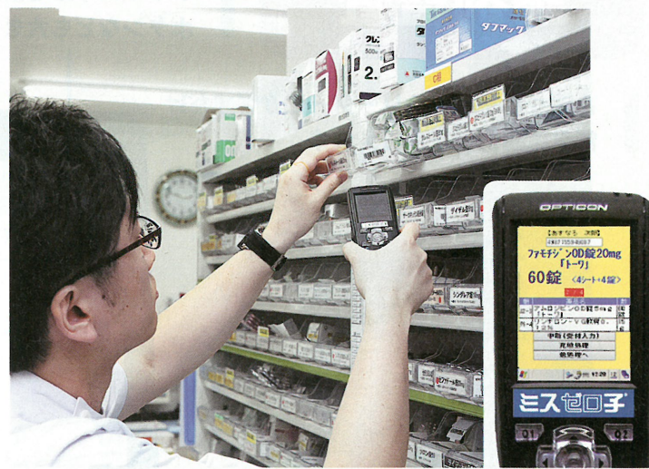
薬品棚にはA、B、C…と番号が付けられ、「ミスゼロ子」の表示と対応させている

できます。複数の薬をピッキングする際には、棚番号順に表示されるため、薬剤師が棚の前を行ったり来たりする動作がなくなり効率的です」と竹内氏は説明する。