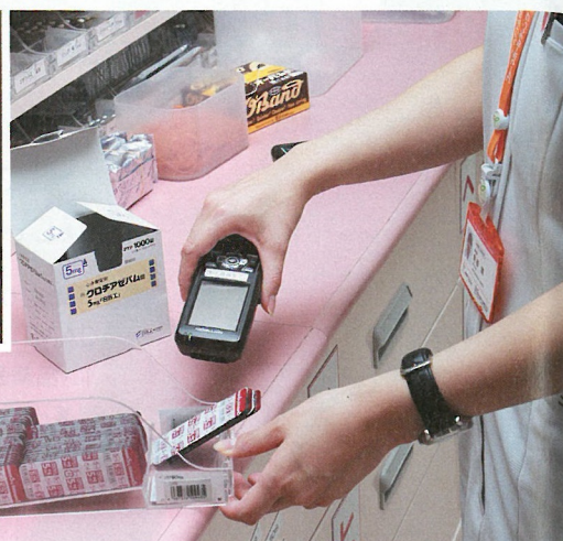
コムファの店舗では、調剤ミスの防止以外に棚卸業務でも「ミスゼロ子」を活用している。左上は棚卸処理を行う際のハンディターミナル画面(見本)