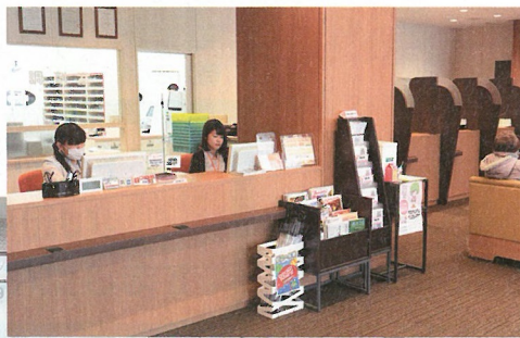
国道36号線に面し、広い店舗面積を誇る、なの花薬局 真栄店