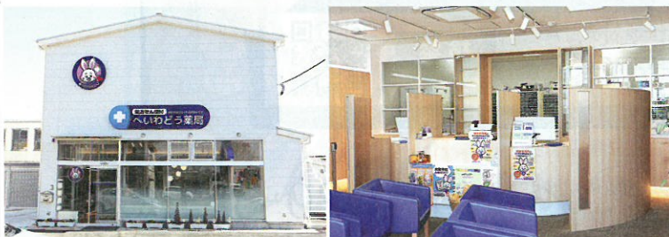
明るく清潔な印象を与える「へいわどう薬局 旭店」