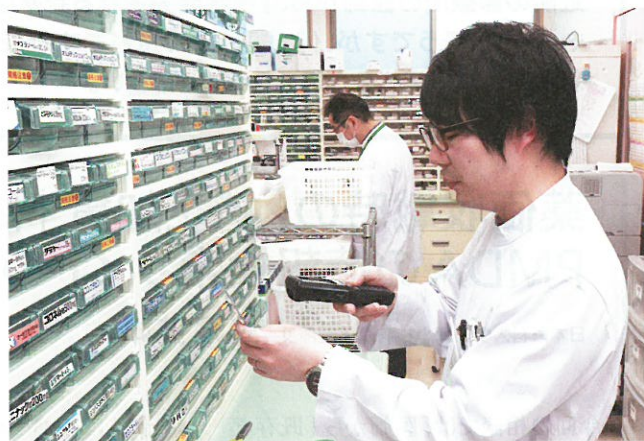
永富調剤薬局では、全店舗まったく同じ使い方での「ミスゼロ子」を運用している

永富調剤薬局 富士見が丘店では、栄養士が作成した健康的な料理のレシピを掲示しているほか、持ち帰ることができるレシピカードも設置している