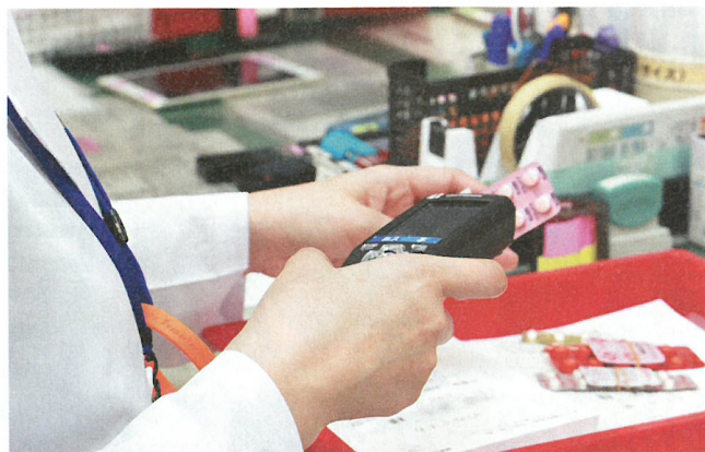
「ミスゼロ子」のハンディ端末はバーコードの認識力に優れており、調剤業務のスピード化を可能にしている