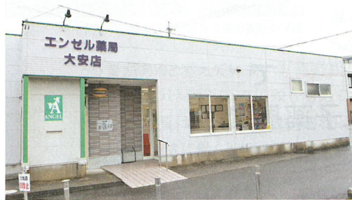
エンゼル薬局 大安店