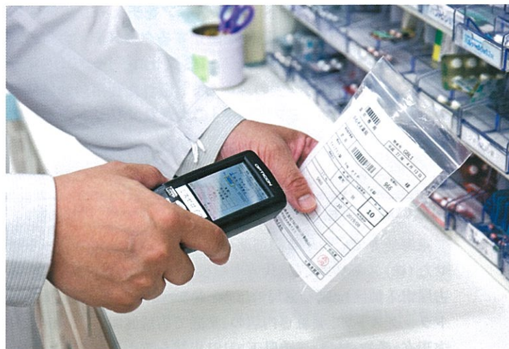
JANコード、GS1-RSSコードに加え、卸会社からの分割販売薬品コードにも対応可能

「小さな個人薬局では当薬局のように1人薬剤師で運営しているところは少ないと思います。1人薬剤師の厳しさは、調剤・監査・投薬を全て1人でやらなければならないことです。しかも薬の規格が増えてきて、ちゃんと20mgで調剤したかどうか、40mgだったろうかなどと、非常に不安になってきた