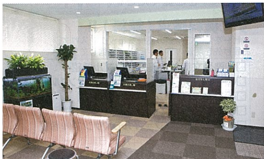
清潔感にあふれた店内では、水槽からのせせらぎにも似た水音が、安らぎの空間を演出する

実際の服薬指導としては「まず、相手に伝わらないと意味がありません。個々の患者さんの年齢や状態をよく見て、話すスピードや声の大きさに注意し、わかりやすく説明する