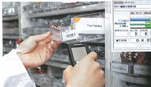
薬剤師1人に1台は必要と、エスマイル薬局 呉本町店では「ミスゼロ子」のハンディ端末を3台稼働させている