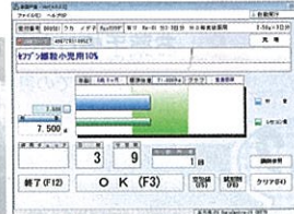
散薬監査の常用量チェック画面